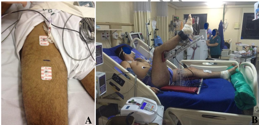
Figura 2. Posicionamento de eletrodos e do membro inferior durante a avaliação de força máxima em UTI.