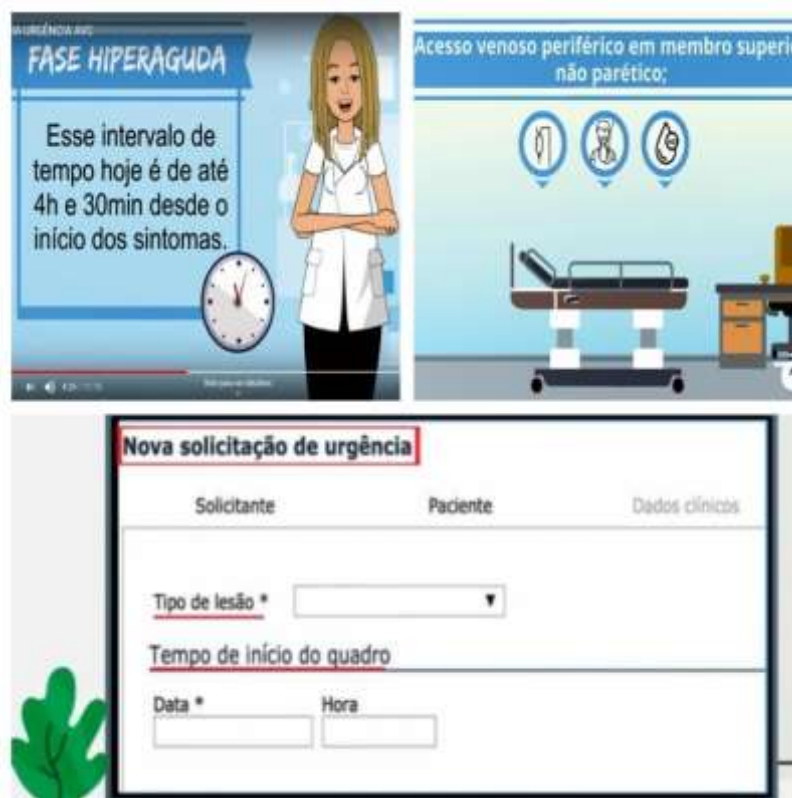
Figura 4 - Recortes do vídeo com informações sobre a fase hiperaguda, os cuidados iniciais no aguardo da vaga e o preenchimento da ficha de regulação. Botucatu, SP, Brasil, 2020.