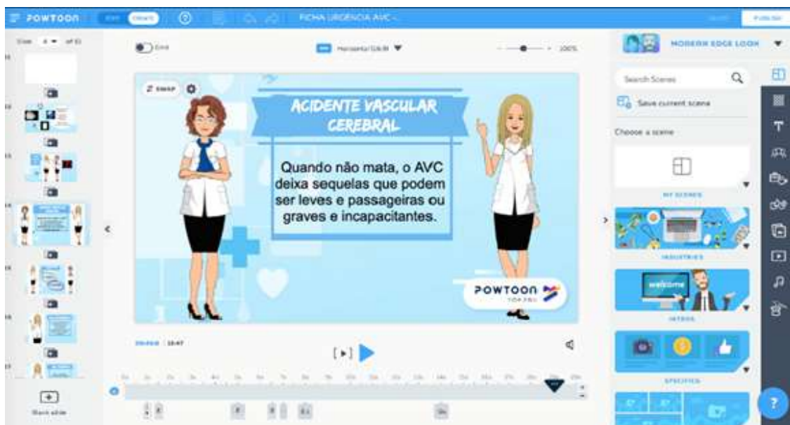
Figura 3 - Imagem da tela do Powtoon contendo o avatar das pesquisadoras. Botucatu, SP, Brasil, 2020.